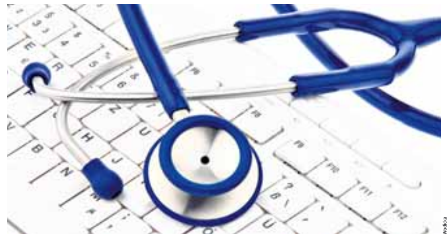
Rascher Zugriff auf Patienten-Akten ist im Gesundheitswesen besonders wichtig

Automatik. Entscheider registrieren die Folgen - unter anderem bei monatlichen Rechnungen. Diese werden oft nur teilweise ausgedruckt und versandt. Manche Objekte gelangen via Fax oder E-Mail zum Empfänger, eben wie es der Kunde will. Den Job kann eine Anwendung automatisch erfüllen. Dann hat die Chefetage gesteigerte Flexibilität schriftlich.